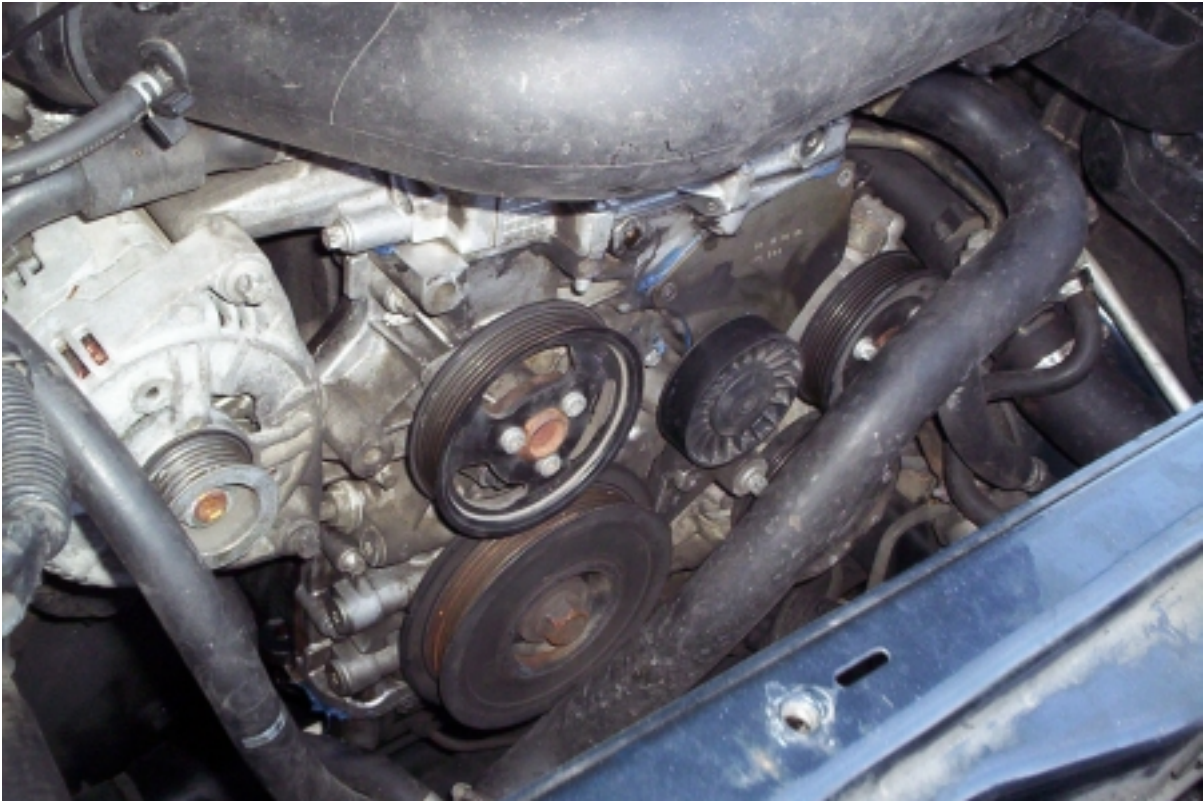
photo 1 - radiateur démonté