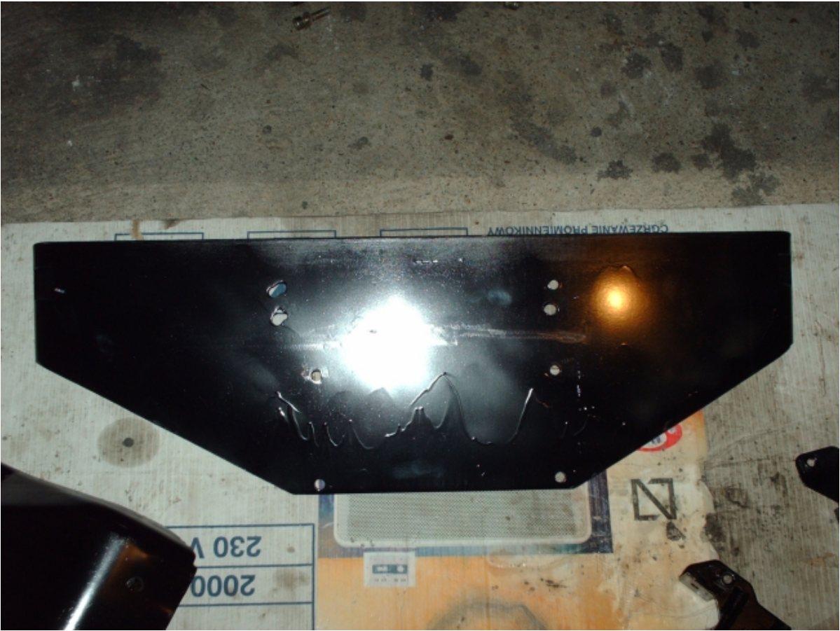
5. Travaux de peinture (et oui, c'est comme cela qu'on dit !)